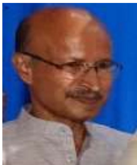
മാസാന്ത്യ കണക്കുകൾ അവതരിപ്പിച്ചു. ചർച്ചകൾക്കും വിശദീകരണങ്ങൾക്കുമൊടുവിൽ റിപ്പോർട്ടും കണക്കുകളും യോഗം അംഗീകരിച്ചു.