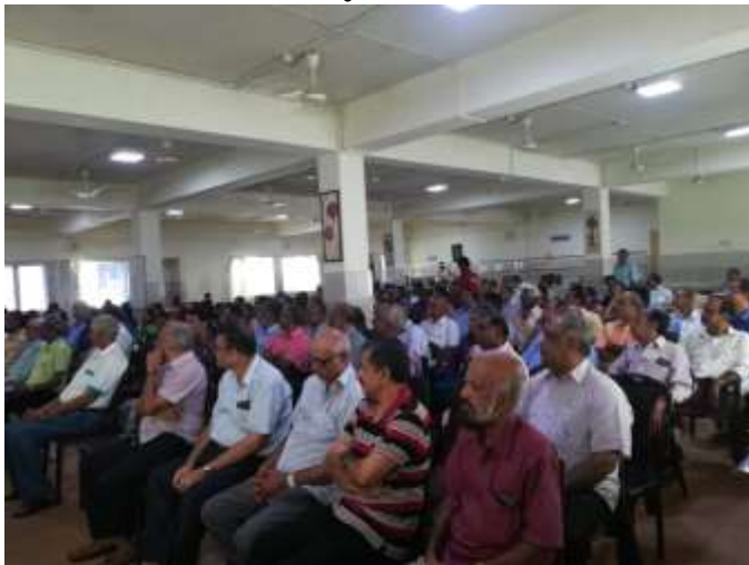
എസ്.ബി.ഐ. പെൻഷനേഴ്സ് അസോസിയേഷന്റെ തിരുവനന്തപുരം ജില്ലാ സമ്മേളനത്തിലെ സദസ്സിന്റെ ഒരു വീക്ഷണം